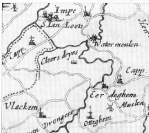
Cleersdries op de Sanderuskaart van het Land van Aalst

In Erondegem waren er drie grote driesen: de Ganzendries, de Koningdries en de Kleerdries. De laatste was opvallend onregelmatig van vorm, zeer uitgestrekt en gelegen op vrij grote afstand van de dorpskern. Dat het een stuk land van enige importantie betrof, blijkt daaruit dat het als ‘Cleersdrys’ een expliciete vermelding kreeg op een kaart van het Land van Aalst in een beroemd boekwerk: Flandria Illustrata van Antonius Sanderus (1644).