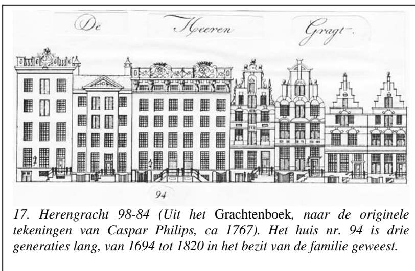
17. Herengracht 98-84 (Uit het Grachtenboek, naar de originele tekeningen van Caspar Philips, ca 1767). Het huis nr. 94 is drie generaties lang, van 1694 tot 1820 in het bezit van de familie geweest.

Zijkamer', 'In 't Voorhuis', 'In de Binnenkamer', 'In het kleine Kamertje', 'In 't Portaal', 'In 't Buffet', 'Op het Agter Soldertje', 'De Bovenzaal', 'Op de Schoorsteen', 'Op de kamer van de Meiden', 'Op de fruitkamer', 'Op de provisiekamer', 'Op de Zaal', 'In de Binnenkamer', 'Zilver', 'Linnengoed in 't Grote Kabinet', 'Linnengoed in 't kleine Kabinet', 'Linnen over 't huis', 'In de binnenkamer in een kas', 'Vrouwe kleederen', 'In de keuken', 'Tin', 'Koojer', 'IJzer', 'In de Kelder', 'In de voorkelder', 'In het Tuynhuis'. En in het koetshuis weet men de vier paarden, genaamd Moor, Pop, Lijs en Boer, die gespannen konden worden voor de 'beste koets' (waarde: f 850), de allermante, de kapwagen, de arreslee, de toeslede of de chais.